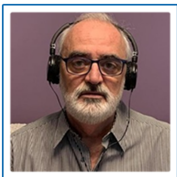
Voltaire Nazi Consultor Executivo Senior do FBDEINEXION Consulting