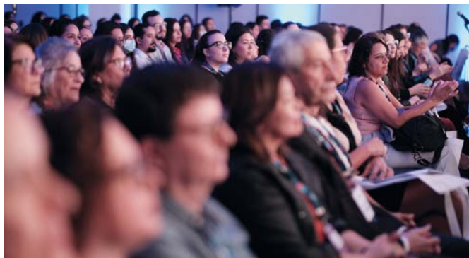
Cientistas, pesquisadores, médicos e estudantes reunidos no Congresso

Por meio de palestras, estudos de casos, mesas-redondas e simpósios, os participantes tiveram a oportunidade de explorar mais sobre: as novas técnicas diagnósticas e práticas clínicas que estão se mostrando promissoras para o tratamento de pacientes oncológicos pediátricos; a introdução de terapias-alvo e imunoterapias, que podem aumentar a sobrevida; novas classes de medicamentos, que diminuam sintomas, aumentam chances de cura e melhoram qualidade de vida; e a importância da atuação multiprofissional no tratamento do câncer pediátrico.