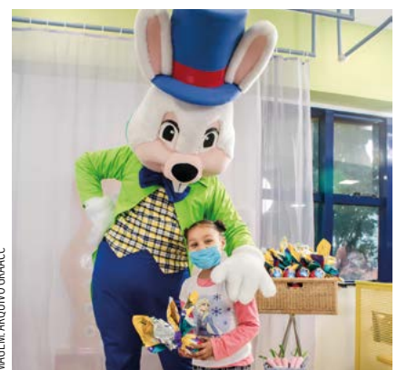
Ação de Páscoa, com distribuição de ovos