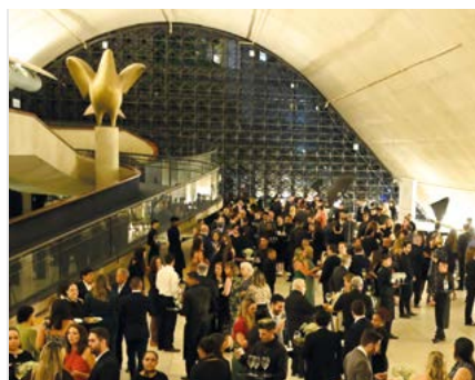
Convidados reunidos no foyer do Memorial