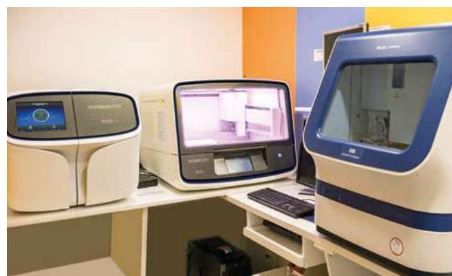
Sequenciador genético de nova geração