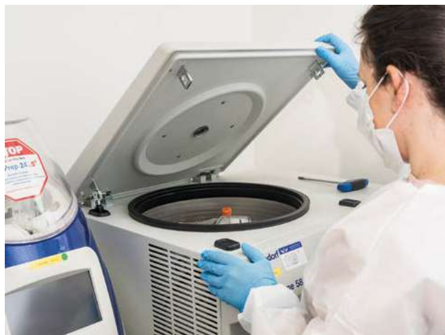
Extração de DNA e RNA

Somos também o primeiro hospital da América Latina no Pediatric Neuro-Oncology Consortium (PNO) , uma rede internacional que reúne hospitais e universidades de referência na pesquisa de tumores pediátricos do sistema nervoso central. Essa participação garante que nossos pacientes tenham acesso a ensaios clínicos inéditos e protocolos atualizados, possibilitando identificar terapias mais inovadoras e com menos efeitos colaterais, muitas vezes ainda indisponíveis de forma ampla no Brasil.